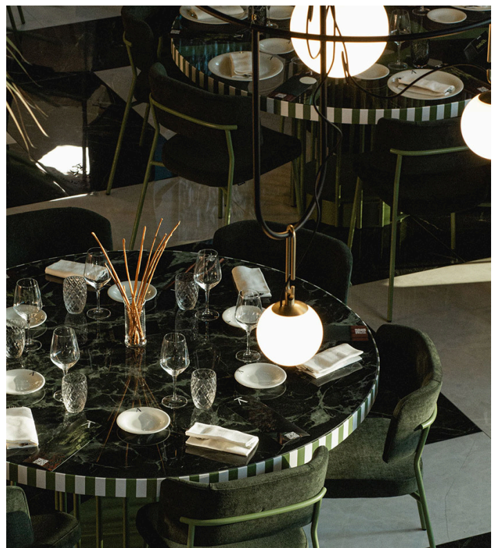
nh S4 Circulaire - Neri&Hu

Lo spazio si materializza in una sequenza di ambienti che ospitano un ristorante, un'accademia per chef professionisti organizzata su postazioni di lavoro ultra-tecnologiche, un american bar / bistrò completato da un "salotto libreria", una cantina internazionale.